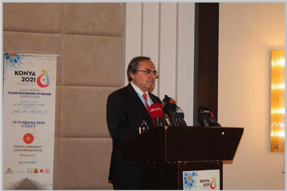
Açılış Oturumundan Kareler