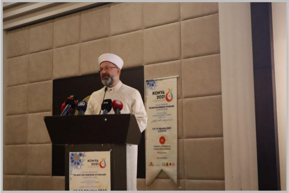
Diyaret İşleri Başkanı Prof. Dr. Ali Erbaş'ın Açılış Konferansı