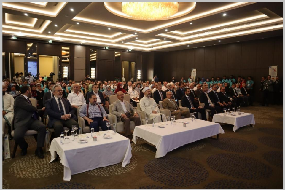
Açılış Oturumu Salondan Genel Bir Görünüş